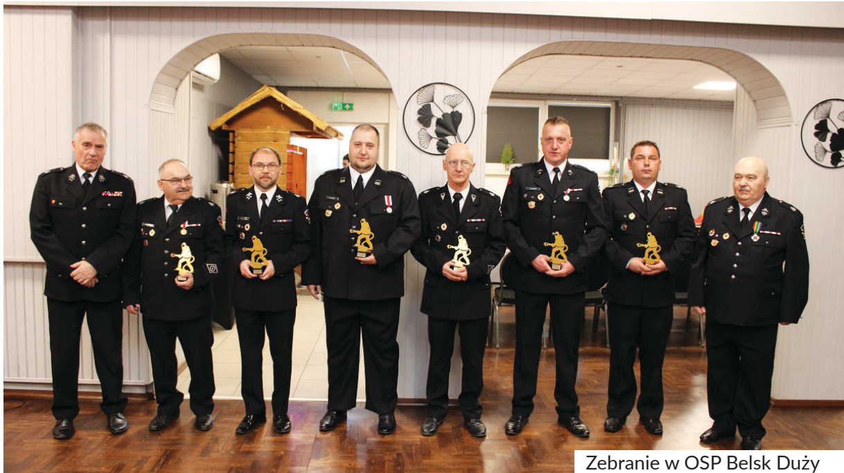
Zebranie w OSP Belsk Duży