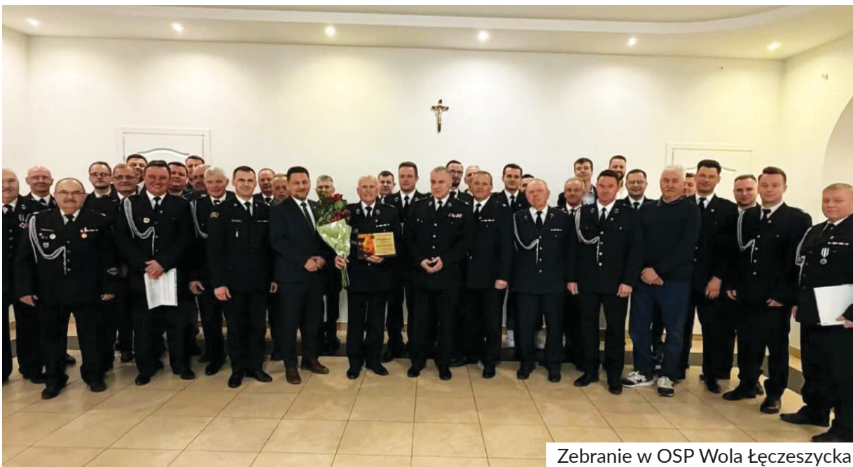
Zebranie w OSP Wola Łęczeszicka