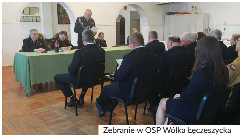
Zebranie w OSP Wólka Łęczeszicka

Zmodernizowali ogrzewanie sali Ubiegły rok jednostka z Wólki Łęczeszickiej zakończyła z 20. wyjazdami do zdarzeń ratowniczo-gaśniczych. W mijających dwunastu miesiącach strażacy wykonali modernizację ogrzewania na sali.