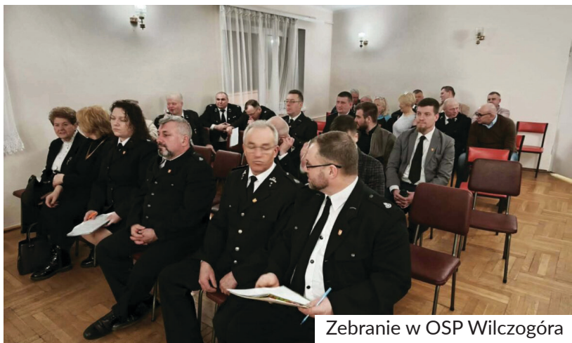
Zebranie w OSP Wilczogóra