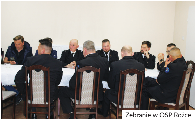
Zebranie w OSP Rożce