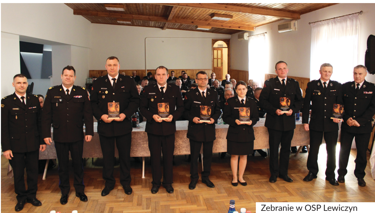
Zebranie w OSP Lewiczyn